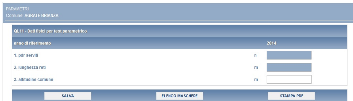
Figura 3.12: maschera PARAMETRI

La maschera prevede la compilazione di tutti i campi ad eccezione di quelli di colore azzurro, i quali non sono editabili e riportano i valori inseriti nei rispettivi campi all’interno della maschera “VIR”.