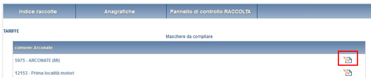
Figura 3.9: elenco località maschera TARIFFE

Premendo il tasto “COMPILA”, viene mostrato per ciascun Comune l'elenco delle località in relazione alle quali è necessario compilare la maschera “TARIFFE” (figura 3.9).