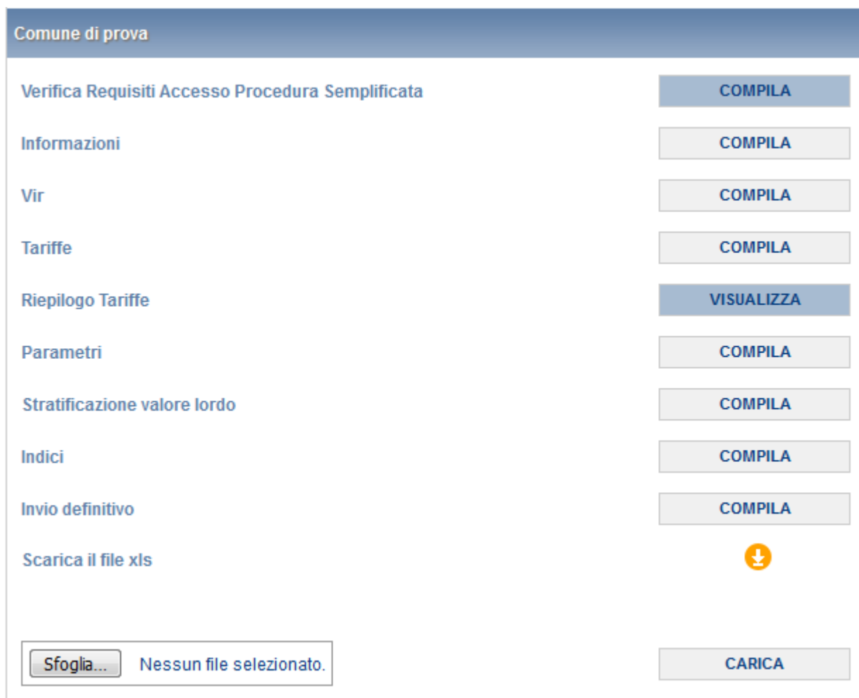
Figura 3.5: pannello di controllo in caso di risposta negativa