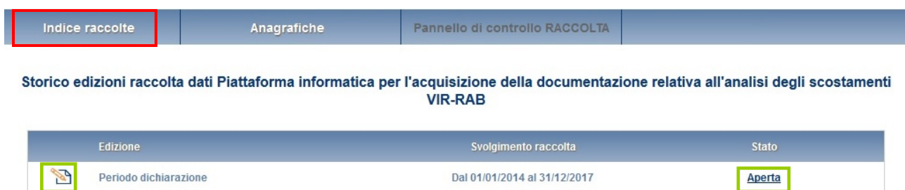
Figura 1.2: storico della raccolta

Accedendo alla raccolta viene visualizzata la pagina “Pannello di controllo” (Figura 1.3), dove è presente l'elenco dei Comuni appartenenti agli ambiti identificati in fase di accreditamento della stazione appaltante ai fini dell'acquisizione dei dati RAB, secondo quanto previsto dalla determinazione del Direttore della Direzione Infrastrutture Unbundling e Certificazione dell'Autorità 14 marzo 2014, n. 5.