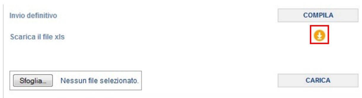
Figura 2.1: Caricamento massivo

Una modalità alternativa di compilazione è il caricamento massivo, disponibile per Comune.