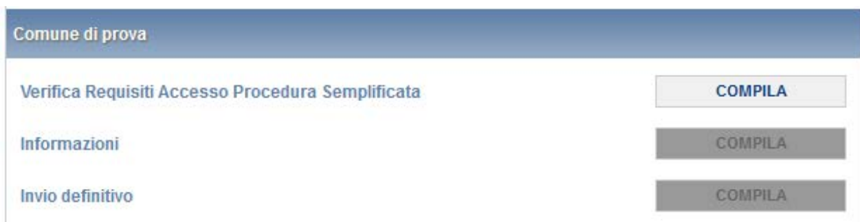
Figura 3.2: pannello di controllo per Comuni che possono scegliere la procedura da compilare

Per i Comuni che rispettano le condizioni di popolazione e numero di pdr sopra citate, il pannello di controllo si presenterà come segue (figura 3.2):