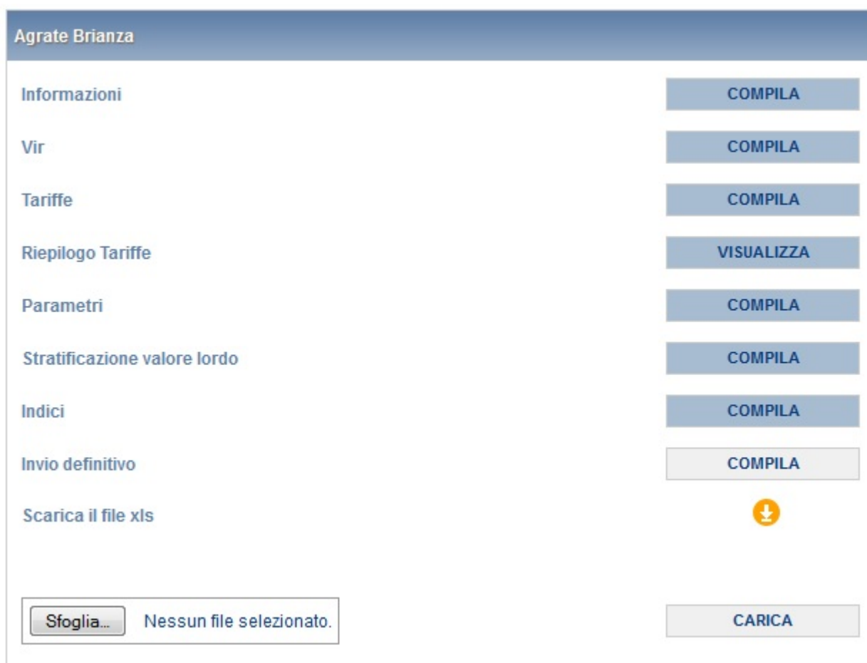
Figura 4.1: maschere per Comune con procedura ordinaria

Quando tutte le maschere per un Comune con scostamento VIR-RAB superiore al 10% sono state compilate, è possibile effettuare l'invio definitivo per il Comune stesso premendo sul bottone "COMPILA" situato in corrispondenza della dicitura "Invio definitivo" (Figura 4.1).